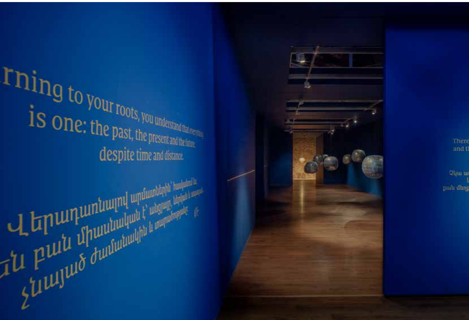
National Pavilion of Armenia: Echo , 11 pieces - Clay (faience), metal oxides, gold, platinum Հայաստանի ազգային տաղավար. «Արձագանք», 11 նմուշ - Կավ (հախճապակի), մետաղների օքսիդներ, ոսկի, պլատին Diameter/Տրամագիծ՝ 43-45 cm 2022