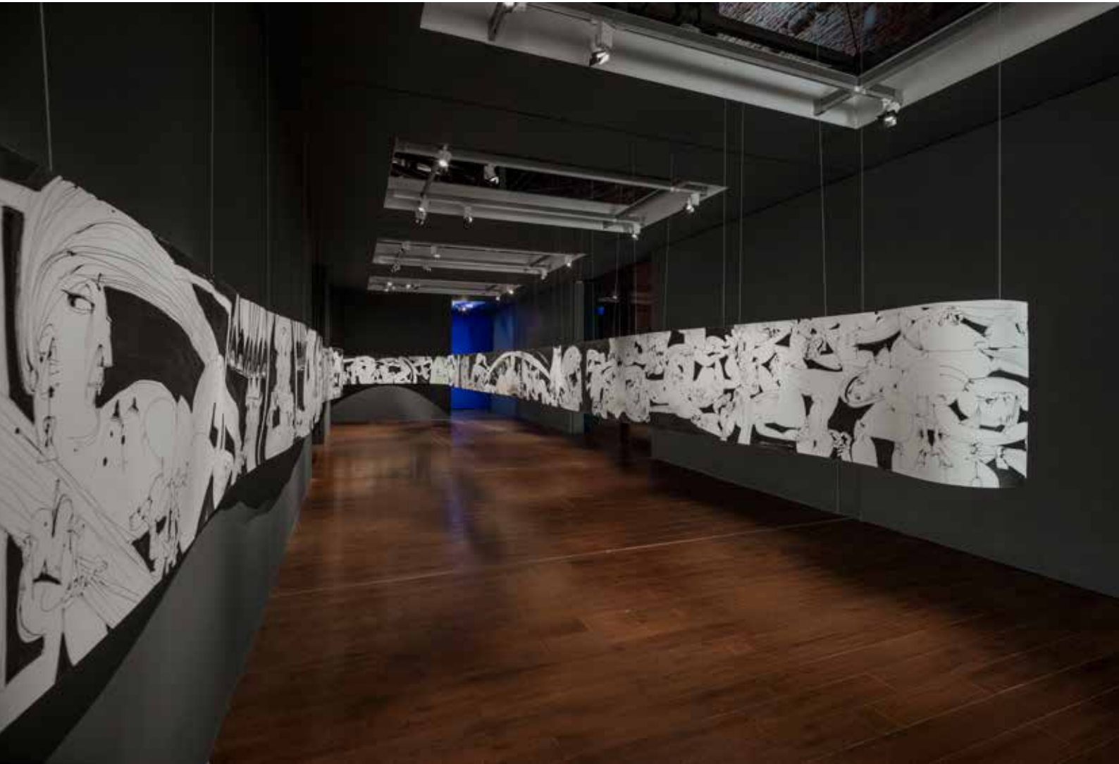
National Pavilion of Armenia: Seven Deadly Sins - Indian ink, paper Հայաստանի ազգային տաղավար. «Յոթ մահացու մեղքեր» - Թուղթ, սուշ 70x5000 cm 2018