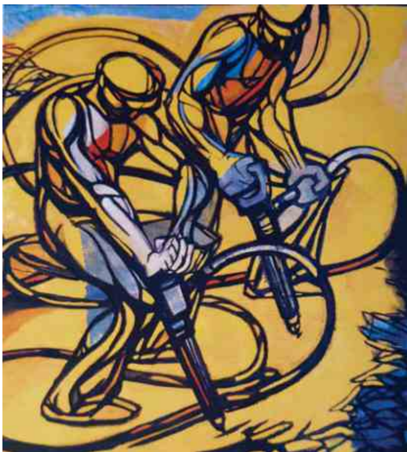
Հորատում Կտավ, յուղաներկ Drilling Oil on canvas 1964