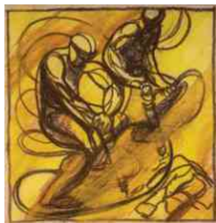
«Հորատում» նկարի էսքիզներ Sketches for the painting Drilling 1964